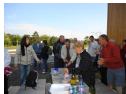
La pause casse croûte !