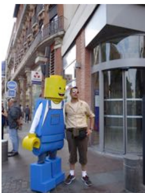
Drôles de personnages dans les rues de Toulouse !