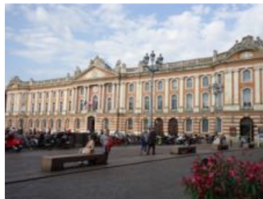
Le Capitole à Toulouse