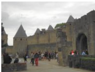
La cité médiévale de Carcassonne