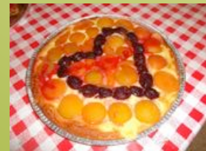
Certains ont de l'imagination !