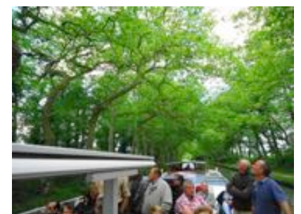
Le Canal du Midi