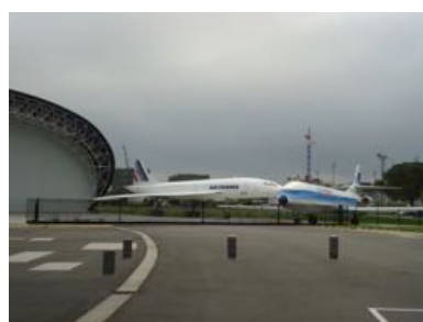
Visite de l'aérospatiale à Toulouse Concorde et Caravelle