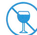
Je ne bois pas d'alcool