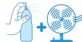
Je mouille mon corps et je me ventile