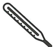
Fièvre > 38°C