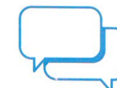
Je donne et je prends des nouvelles de mes proches