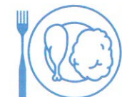
Je mange en quantité suffisante