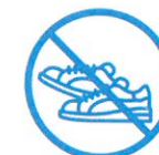
J'évite les efforts physiques